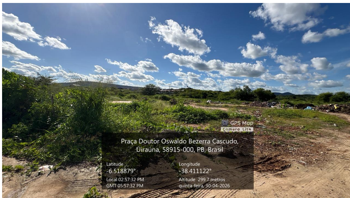
Foto 06 - Registro geral da área destinada ao Parque de Exposição, com solo exposto e vegetação no entorno, evidenciando o potencial de aproveitamento do local. Coordenadas: Lat. -6.518879° / Long. -38.411122°.