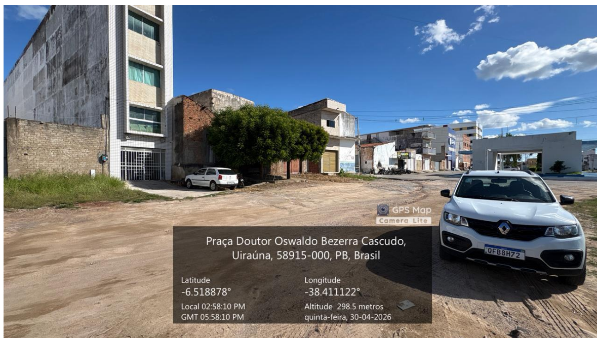
Foto 01 - Vista geral da área destinada à intervenção do Parque de Exposição, com solo exposto, edificações no entorno e necessidade de organização do espaço. Coordenadas: Lat. -6.518878° / Long. -38.411122°.