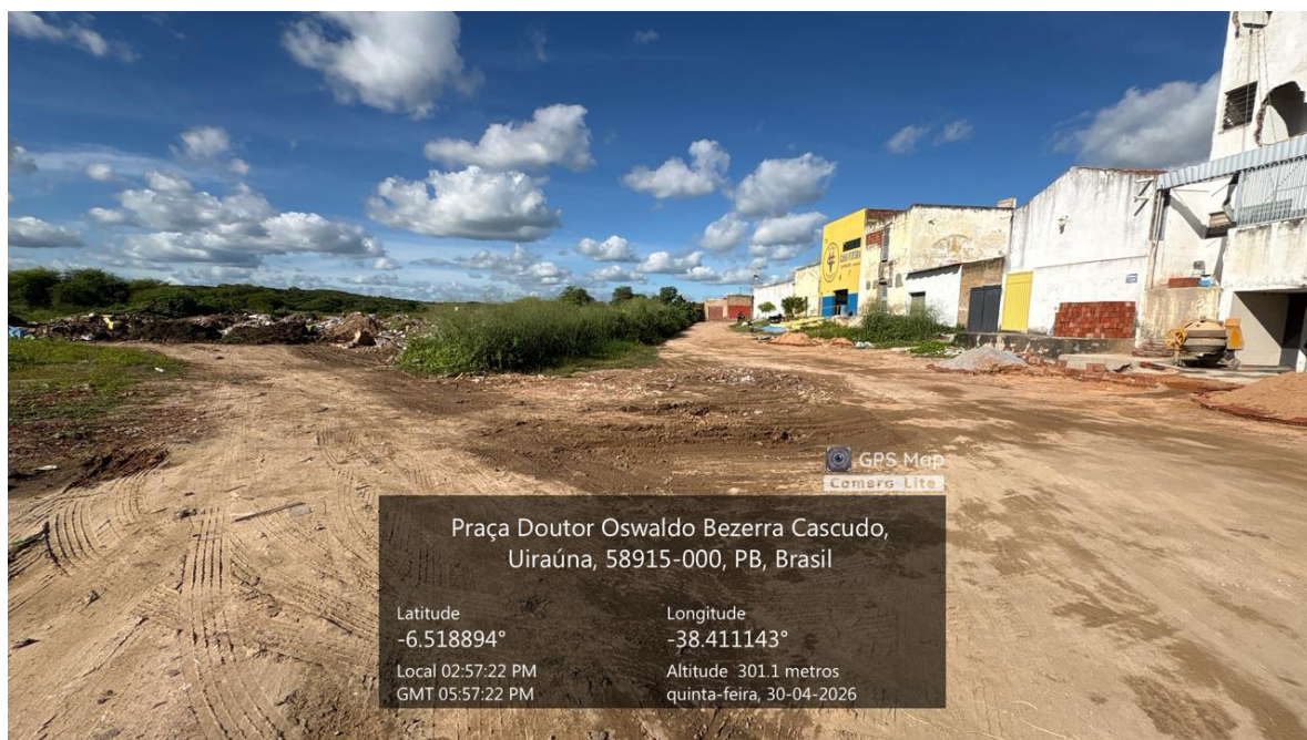
Foto 03 - Vista da área de acesso e circulação, com trecho em solo natural, presença de resíduos e necessidade de regularização para implantação do projeto. Coordenadas: Lat. -6.518894° / Long. -38.411143°.