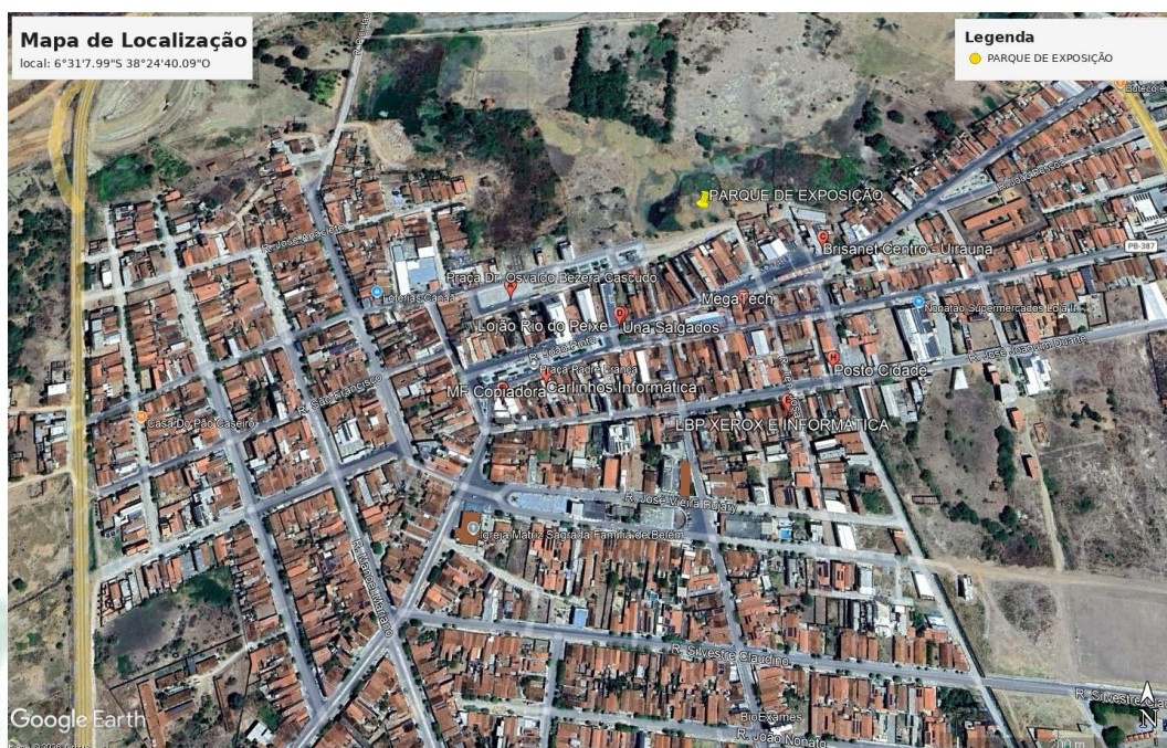
Imagem 02 - Vista ampliada da localização da área de intervenção em relação à malha urbana do Município de Uiraúna/PB.