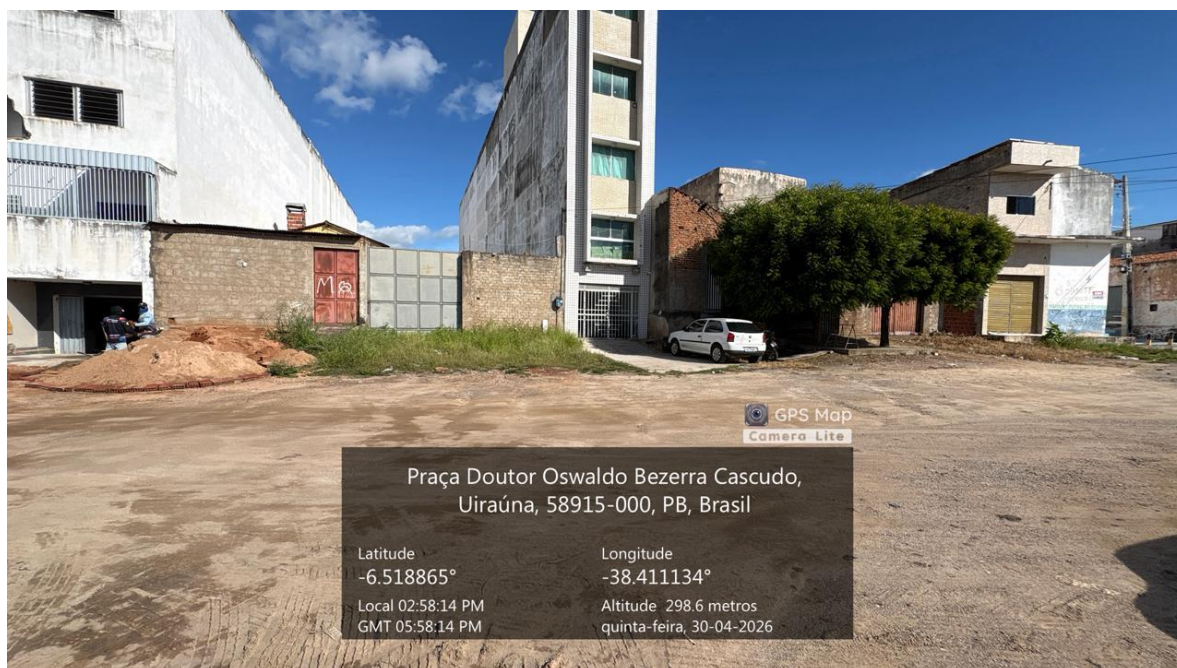
Foto 02 - Registro do entorno imediato, demonstrando área livre em solo natural, vegetação rasteira e edificações existentes. Coordenadas: Lat. -6.518865° / Long. -38.411134°.