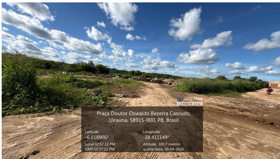
Foto 05 - Vista panorâmica de trecho do terreno com resíduos dispersos e vegetação no entorno, indicando necessidade de requalificação do espaço público. Coordenadas: Lat. -6.518906° / Long. -38.411149°.